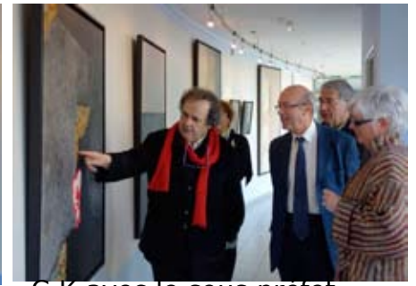
C.K avec le sous préfet et l'adjoint au maire