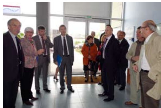
visite du recteur avec le préfet et le DASEN