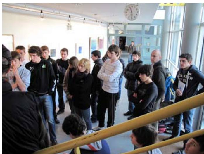
une classe d'ado vue d'Auch